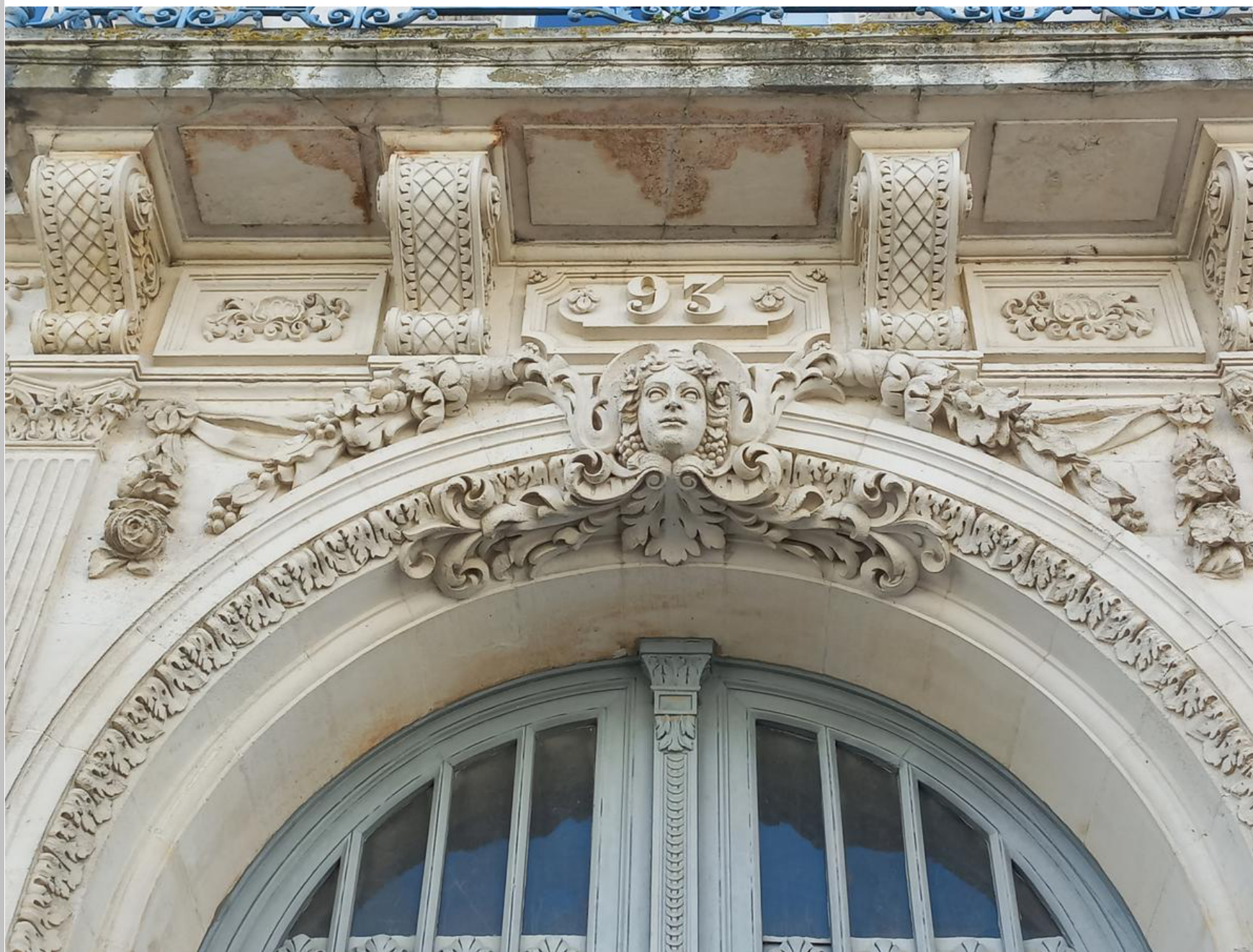
Les mascarons qui ornent certaines façades peuvent aussi être intéressants.